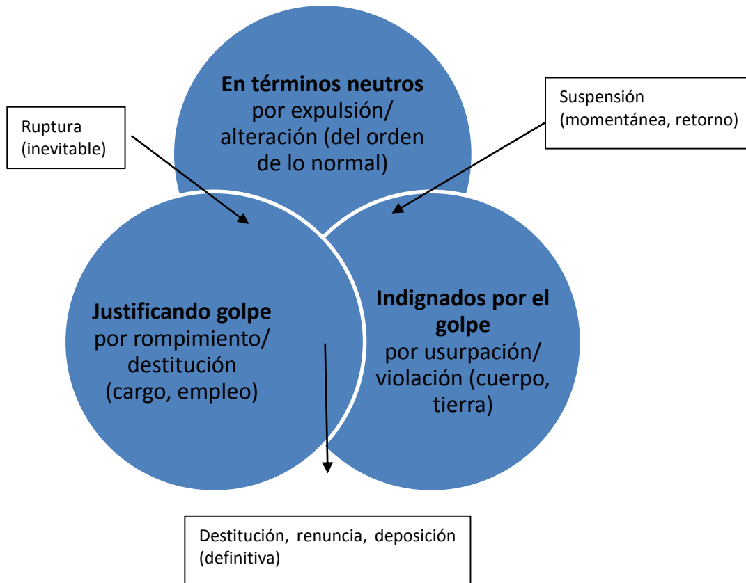
Gráfico N° 4 Lo que cesa temporal o totalmente

Según la posición que se adopta en el escrito, aquello que cesa viene por la “expulsión” de Zelaya, lo cual causa una “alteración” del orden de lo normal; o por “usurpación” y consecuente “violación”, lo cual señala hacia la metáfora del cuerpo violado, de la tierra usurpada; o por “rompimiento” (lo que no aguanta más) y se encuentra reflejado en una “destitución”, término que refiere a un cargo, empleo, y en principio no es cuestionable o al menos reversible, pues lo efectúa un superior.