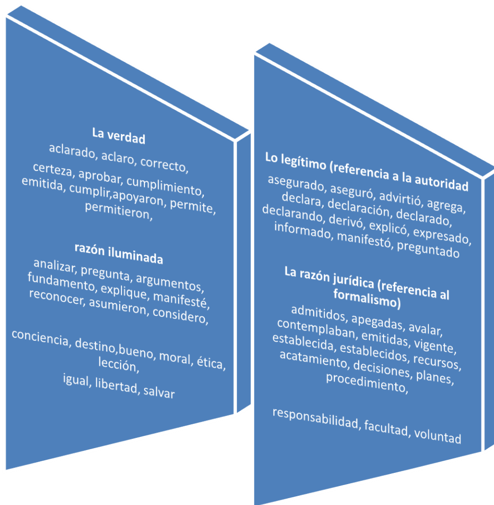
Gráfico N° 1 Campos semánticos opuestos entre quienes justifican el golpe y aquellos que se indignan por este

En este contexto “no” reagrupa la oposición entre los que se encuentran indignados por el golpe y proclaman “la verdad” de lo que ha sucedido, y los que justifican el golpe refiriendo a la legitimidad de sus acciones.